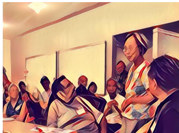
Residente hablando sobre los últimos avances en Chinatown Reunión de la Comunidad, julio de 2016

En los últimos años pasados, Chinatown de Los Angeles ha visto a muchos cambios. Los inquilinos, propietarios de empresas y casas, turistas, y miembros de la comunidad todo han visto a nuevos proyectos de vivienda entrando en Chinatown. Los promotores inmobiliario están proponiendo construir un edificio con 244 unidades residenciales y 8,000 pies cuadrados de espacio comercial al lugar del Burger King, a la cruce de la calle Cesar Chavez y la avenida Grand. Este edificio va a afectar el vecindario alrededor con más tráfico y más profesionales jóvenes. Otro complejo de edificios será construido a la cruce de las calles College y Spring con 770 unidades residenciales y 51,000 pies cuadrados de espacio comercial. Estos dos lugares de vivienda tendrán solamente espacio a la tasa de mercado, comercializadas a personas rico y soltero. No tendrán viviendas asequibles y para familias. Estos dos son ejemplos del aburguesamiento que ha subido y va a continuar subiendo los alquileres para inquilinos en Chinatown, el aburguesamiento que va a desplazar inquilinos en Chinatown, y, a menos que nosotros trabajamos junto a luchar por un Chinatown para todos, el aburguesamiento que va a cambiar mucho el carácter del vecindario.