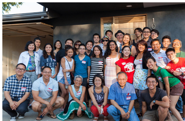
CCED 2015 Recaudación de Fondos